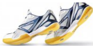
Stiga Schuh Instinct II