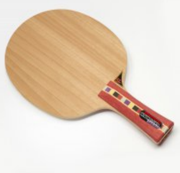
Donic Ovtcharov Senso V2