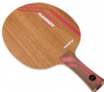
andro Flaxonite Driver OFF