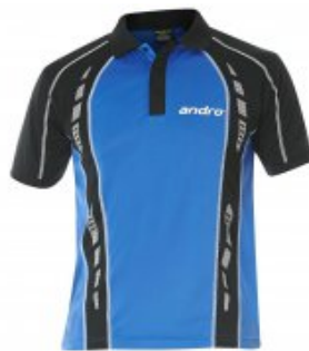
andro Mago blau/schwarz