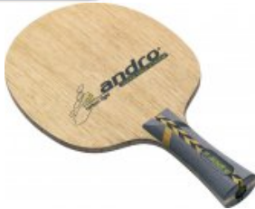
andro Super-Core CL OFF

gerade, konkav, anatomisch statt 56,95 € nur 41,95 € * Sie sparen 15,00 € (26%)