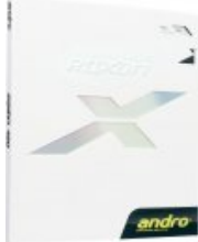
andro ROXON 450

1,8/2,0/max rot/schwarz statt 41,95 € nur 30,95 € * Sie sparen 11,00 € (26%)