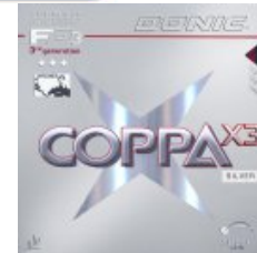
Donic Coppa X3 Silver

1,8/2,0/max rot/schwarz statt 42,90 € nur 29,90 € * Sie sparen 13,00 € (30%)