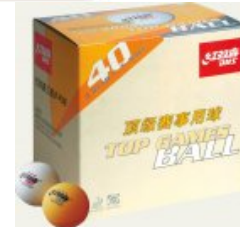
DHS *** 144er Pack

orange statt 159,00 € nur 99,90 € * Sie sparen 59,10 € (37%)