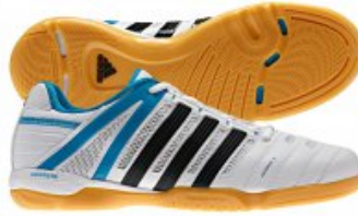
adidas Schuh MiTTennium Fast

3,5 - 13 weiß/blau/schwarz statt 99,95 € nur 69,95 € * Sie sparen 30,00 € (30%)