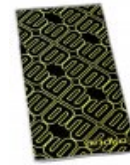
andro Handtuch Tournament