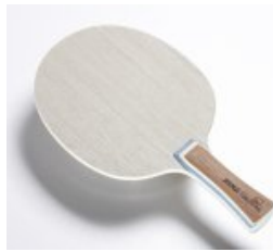
Joola Greenline medium

statt 39,90 € nur 27,90 € * Sie sparen 12,00 € (30%)