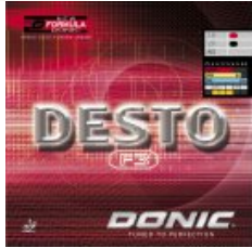
Donic DESTO F3

statt 35,90€ nur 25,90 €* Sie sparen 10,00 € (28%)