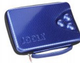
Joola Schlägerhülle Trox Square - blau

statt 49,90€ nur 14,90 €* Sie sparen 5,00 € (25%)