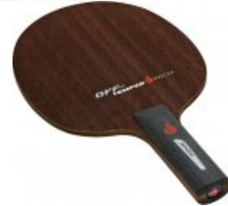
andro TEMPER TECH OFF-

statt 49,95€ nur 34,95 €* Sie sparen 15,00 € (30%)