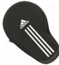
adidas Thermo Bag schwarz

statt 29,95€ nur 19,95 €* Sie sparen 10,00 € (33%)