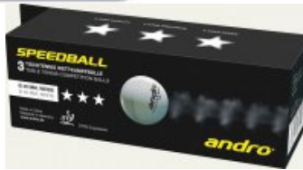
andro *** Speedball 3Star

statt 424,95€ nur 10,95 €* Sie sparen 114,00 € (27%)