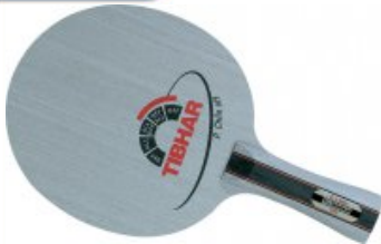
Tibhar Chila OFF

statt 32,90€ nur 24,50 €* Sie sparen 8,40 € (26%)