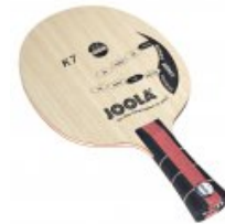
Joola K7 extreme