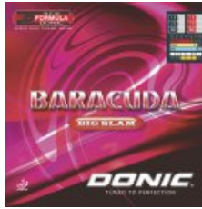
Donic Baracuda Big Slam