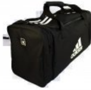
adidas Gear Bag