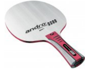
andro Super Core CELL OFF-