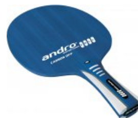
andro Super Core CELL Carbon OFF

statt 69,95-€ nur 51,95 €* Sie sparen 18,00 € (26%)