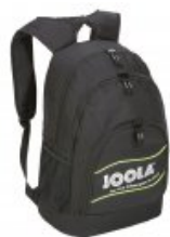
Joola Rucksack Reflex 13

statt 29,90-€ nur 21,90 €* Sie sparen 8,00 € (27%)