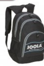
Joola Rucksack Reflex 13

statt 29,90 € nur 21,90 € * Sie sparen 8,00 € (27%)