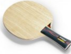
Donic Persson Power AR Senso V2

statt 35,90 € nur 24,90 € * Sie sparen 11,00 € (31%)