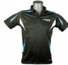
Stiga Hemd Style schwarz/blau

statt 37,90 € nur 26,90 € * Sie sparen 11,00 € (29%)