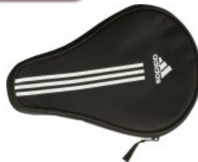
adidas Single Cover

statt 9,95 € nur 7,95 € * Sie sparen 2,00 € (20%)