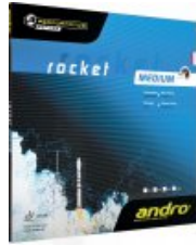
andro Rocket medium

statt 26,95 € nur 20,95 € * Sie sparen 6,00 € (22%)