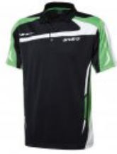
andro Agus Polo Men schwarz/grün

statt 39,95€ nur 25,95 €* Sie sparen 14,00 € (35%)