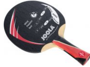
Joola WING PASSION fast

statt 49,90€ nur 36,90 €* Sie sparen 13,00 € (26%)