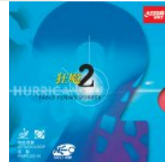
DHS NEO Hurricane II

statt 34,90 € nur 21,90 €* Sie sparen 10,00 € (31%)