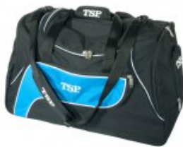
TSP Tasche Tomo Match

statt 42,90 € nur 29,90 €* Sie sparen 13,00 € (30%)