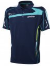
andro Agus Polo Men blau/petrolgrün

statt 39,95 € nur 25,95 €* Sie sparen 14,00 € (35%)