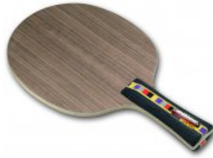
Donic Ovtcharov Senso V1

statt 45,90 € nur 29,90 €* Sie sparen 16,00 € (35%)