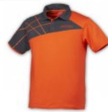
Donic Shirt California orange/anthrazit