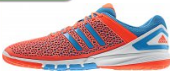
adidas Schuh Courtblast rot/blau