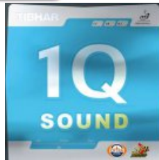
Tibhar 1Q Sound