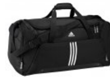
adidas Essent Teambag Large

statt 44,95 € nur 34,95 €* Sie sparen 10,00 € (22%)