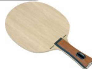
Stiga Allround Classic