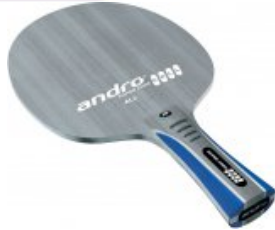
andro Super Core CELL ALL