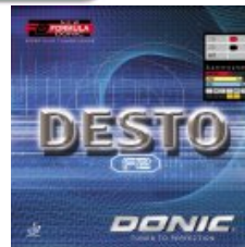
Donic Desto F2