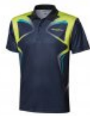
andro Ripoll schwarz/sulphur/petrolgr?n

statt 44,95 € nur 24,95 €* Sie sparen 20,00 € (44%)