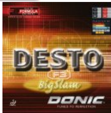
Donic Desto F3 BigSlam