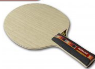
Donic Waldner SENSO CARBON

statt 55,90 € nur 38,90 €* Sie sparen 17,00 € (30%)