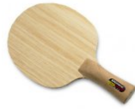
Donic DIMA SawTec AR

statt 35,90 € nur 24,90 €* Sie sparen 11,00 € (31%)