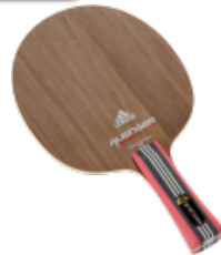
adidas Avenger Carbon