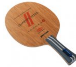
Victas Quartet Speed II