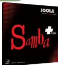
Joola Samba Plus