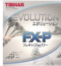
Tibhar Evolution FX-P