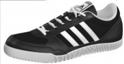
adidas Schuh TT24/7 sw/w