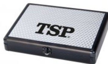
TSP Alucase Pro 3D silber