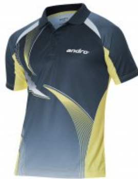
andro Kaitos - nachtblau/gelb