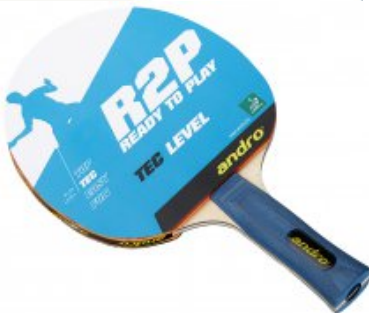
andro Schläger R2P TEC LEVEL