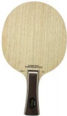
Stiga Infinity VPS V