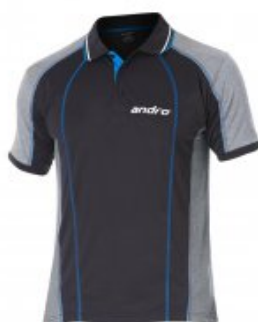
andro® Corbin grau/deepsea