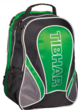
Tibhar Rucksack Century