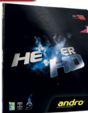
andro® Hexer HD