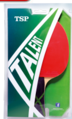
TSP Schläger Talent