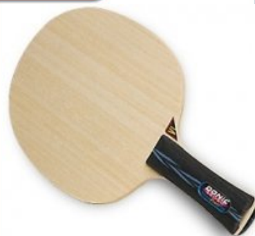
Donic Persson Powerplay Senso V1