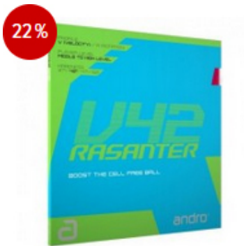
andro Belag Rasanter V42