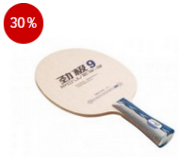
DHS Holz PG9 L