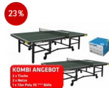
2er Kombi andro Magnum SC grün