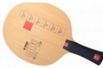
TSP Holz Balsa 6.5