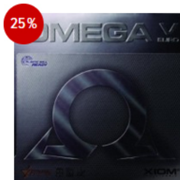
XIOM Belag Omega V Europe