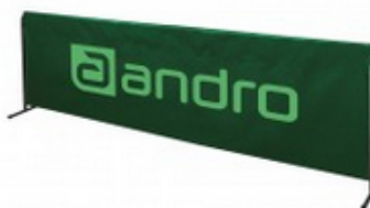
andro Umrandung Stabilo - 5er-Set