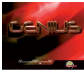
Tibhar Belag Genius