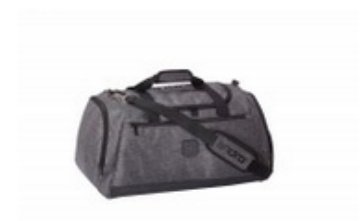
andro Tasche Mid Munro grau/schwarz