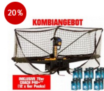
Donic Robo Pong 2055+ Coach P40+**