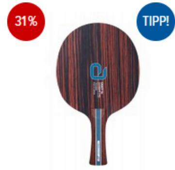
andro Holz Gauzy SL OFF