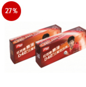
DHS Ball*** Dual 40+ weiß - 100er