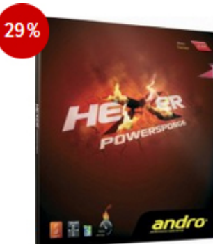
andro Belag Hexer Powersponge