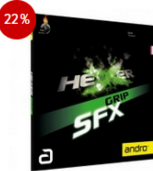
andro Belag Hexer Grip SFX