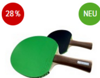
andro Komplettschläger Ligni ALL konkav