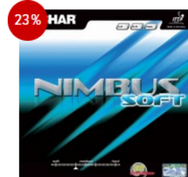
Tibhar Belag Nimbus Soft