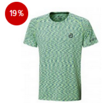
andro Trikot Melange Multicolor grün/dunkelblau