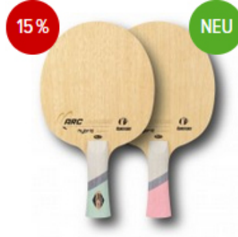
Kokutaku Holz ARC HYBRID Inner