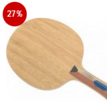
Dr. Neubauer Holz Firewall Plus