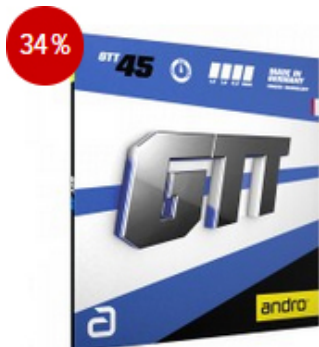
andro Belag GTT 45