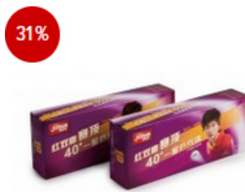
DHS Ball* Dual 40+ weiß - 120er