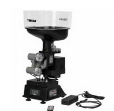
Tibhar Robot Robopro Junior