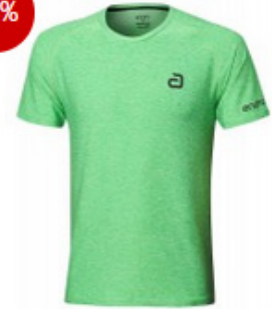
andro Trikot Melange Alpha grün CASUAL