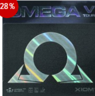
XIOM Belag Omega V Tour