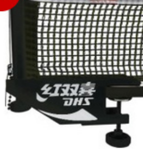
DHS Netzgarnitur P 104