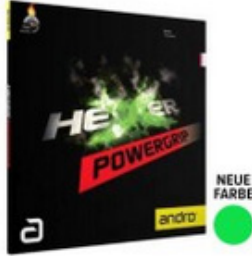
andro Belag Hexer Powergrip