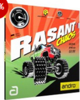
andro Belag Rasant Chaos