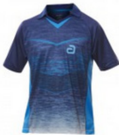
andro Hemd Minto - dunkelblau/blau