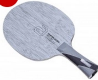
andro Holz Kanter CO OFF