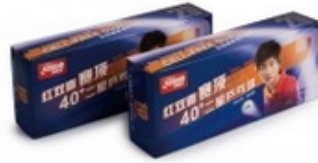
DHS Ball** Dual 40+ weiß - 120er