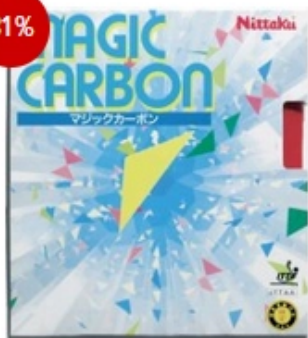
Nittaku Belag Magic Carbon