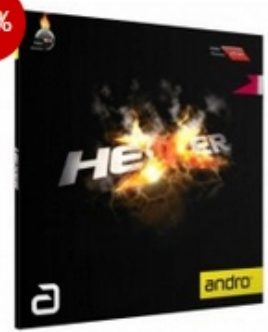
andro Belag Hexer