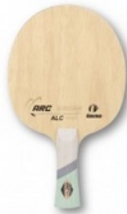
Kokutaku Holz ARC ALC Inner