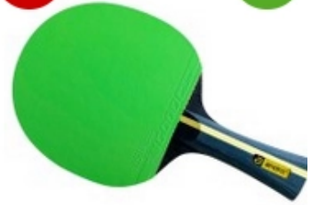
andro Komplettschläger I 100 G - konkav