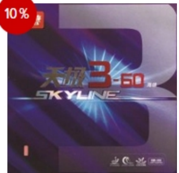
DHS Belag Skyline 3-60 Mid 37°