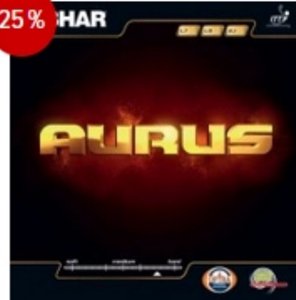
Tibhar Belag Aurus