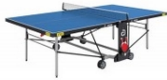
andro TT-Tisch Outside - blau