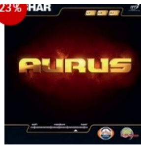
Tibhar Belag Aurus