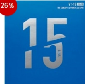
Victas Belag V>15 Stiff