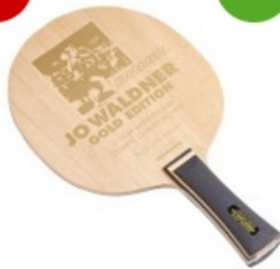
Donic Holz JO Waldner Gold Edition