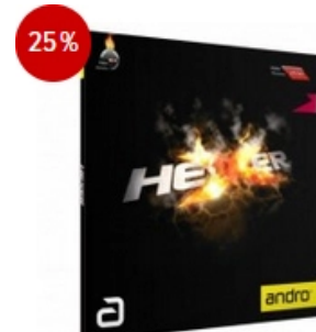
andro Belag Hexer