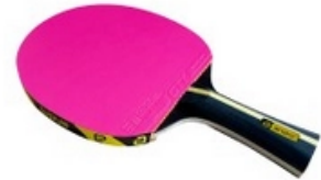
andro Komplettschläger I 200 P - konkav