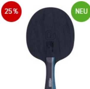
andro Holz Timber 5 ALL Black