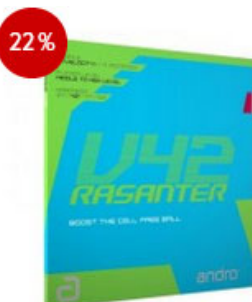
andro Belag Rasanter V42