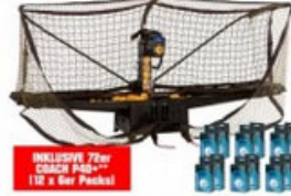
Donic Robo Pong 2055+ Coach P40+**