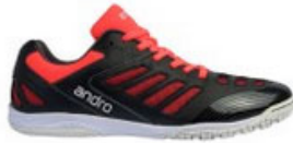
andro Schuh Cross Step 2 schwarz/neonrot