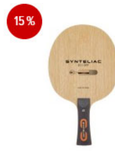
andro Holz Synteliac ZCI