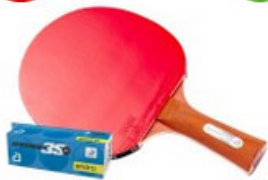
andro Set Buzzer Pro 500RX