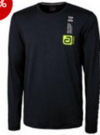
andro Longsleeve Sisco schwarz/gelb