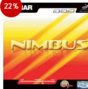
Tibhar Belag Nimbus