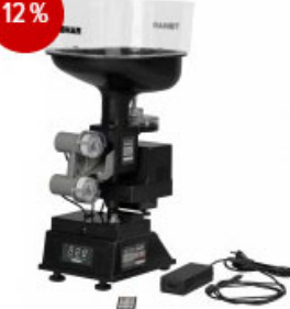
Tibhar Robot Robopro Junior