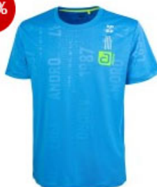
andro Shirt Dexar blau/grün