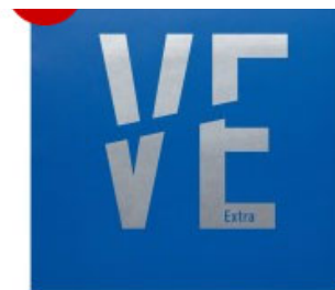
Victas Belag Ventus Extra