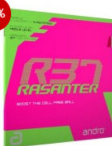
andro Belag Rasanter R37