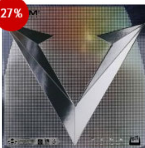
XIOM Belag Vega Japan