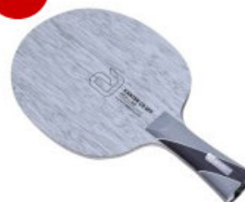
andro Holz Kanter CO OFF