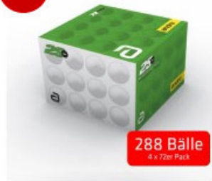
andro Ball Poly2S** weiß 4er-Kombipaket