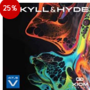
XIOM Belag Jekyll&Hyde V47,5