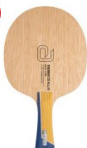
andro Holz Treiber CO ALL/S