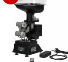
Tibhar Robot Robopro Junior