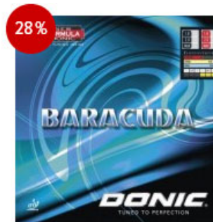
Donic Belag Baracuda