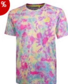
andro Shirt Barci multicolor