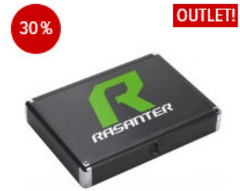
andro Alu Case Rasanter