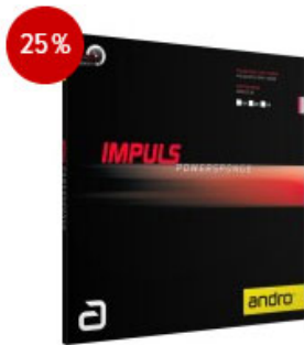
andro Belag Impuls Powersponge